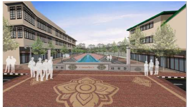
หลังพัฒนา

3. การพัฒนาโครงสร้างพื้นฐานและระบบโลจิสติกส์เพื่อรองรับการเป็นศูนย์กลางเชื่อมโยงภูมิภาคและการแก้ไขปัญหา และสนับสนุนการขับเคลื่อนแผนพัฒนาจังหวัดพระนครศรีอยุธยา ดำเนินการปรับปรุงถนนในสายทางที่มีการสัญจรของประชาชนจำนวนมาก ได้รับความเสียหายจากการใช้งานเป็นเวลานานและเส้นทางไม่อาจรองรับการพัฒนาในพื้นที่ได้อย่างมีประสิทธิภาพ โดยปรับปรุงถนน จำนวน 7 สายทาง ระยะทางรวมทั้งสิ้น 10.071 กิโลเมตร ซึ่งการดำเนินงานดังกล่าวจะช่วยให้ประชาชนได้รับประโยชน์จากการใช้เส้นทาง โดยพื้นที่ตามแนวเส้นทางมีบ้านเรือนของประชาชนจำนวนมากและเป็นเส้นทางเชื่อมโยงไปสถานที่ท่องเที่ยวอื่นๆของจังหวัด ซึ่งจะช่วยลดอุบัติเหตุทางถนนที่จะเกิดขึ้น มีปริมาณการจราจร รวมทั้งสิ้น 28,413 คัน/วัน อีกทั้งยังมีการปรับปรุงท่อเมนประปา ระบบน้ำบาดาล จำนวน 1 แห่ง ความยาว 13.535 กิโลเมตร พร้อมทั้งขุดเจาะบ่อบาดาลพร้อมถังประปา จำนวน 2 แห่ง ก่อสร้างถังสูงระบบประปาหมู่บ้าน จำนวน 1 แห่ง ประชาชนได้รับประโยชน์ 1,339 ครัวเรือน