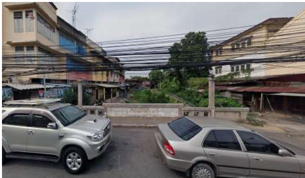
ก่อนพัฒนา

2. การบริหารจัดการทรัพยากรธรรมชาติและสิ่งแวดล้อมที่มีประสิทธิภาพบนพื้นฐานการมีส่วนร่วมของทุกภาคส่วน ดำเนินการปรับปรุงภูมิทัศน์บริเวณคลองมหาไชย ตำบลหัวรอ อำเภอพระนครศรีอยุธยา จังหวัดพระนครศรีอยุธยา (ระยะที่ 1) เพื่อเป็นแหล่งพักผ่อนใหม่ของจังหวัด และเชื่อมโยงสถานที่ระหว่างตลาดหัวรอกับสวนสาธารณะเดิม เพื่อให้ประชาชนสามารถใช้งานได้อย่างมีประสิทธิภาพ